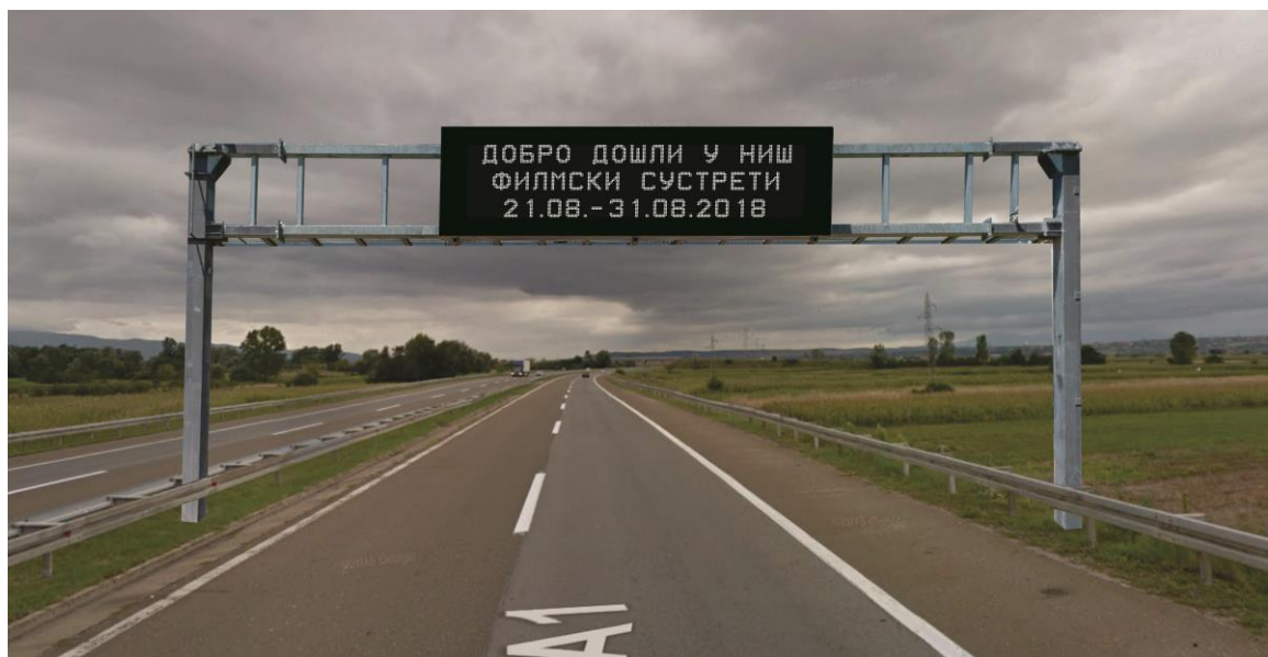
Предлог локације за инсталацију знака Зн3, испред искључења Ниш Југ, из правца Београда