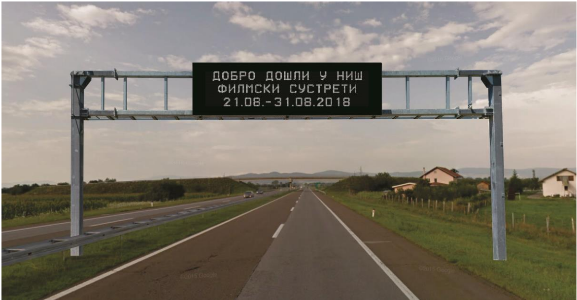
Предлог локације за инсталацију знака Зн4, испред искључења Ниш Југ, из правца Лесковца