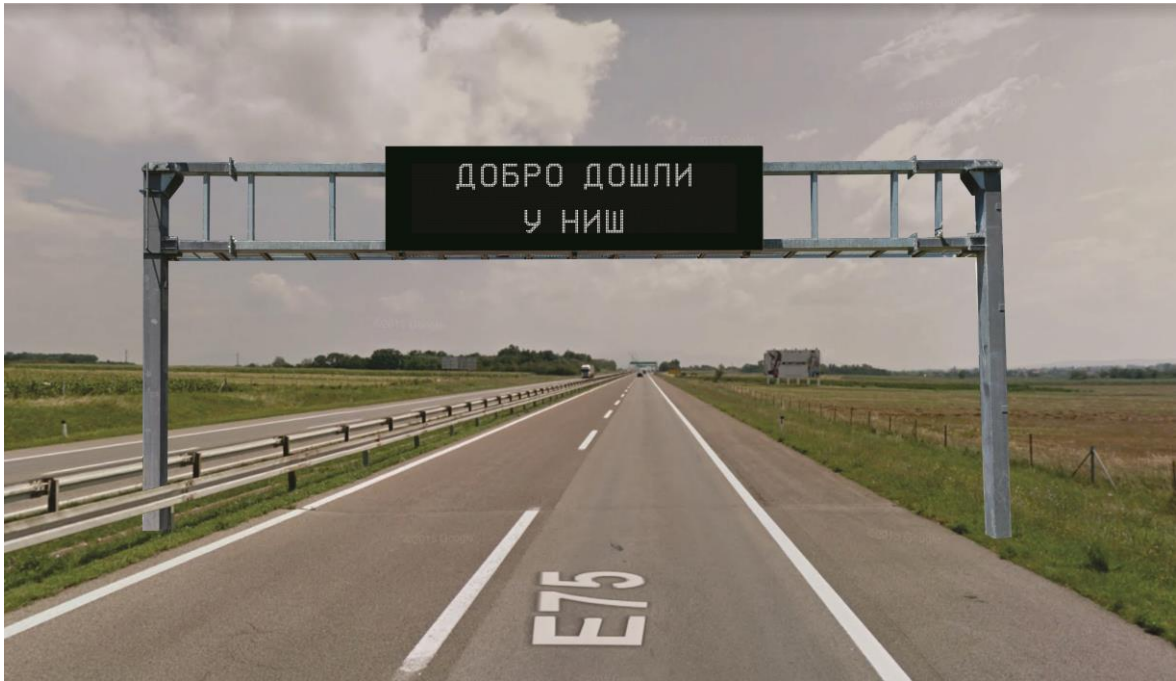
Предлог локације за инсталацију знака Зн2, испред искључења Ниш Север, из правца Пирота