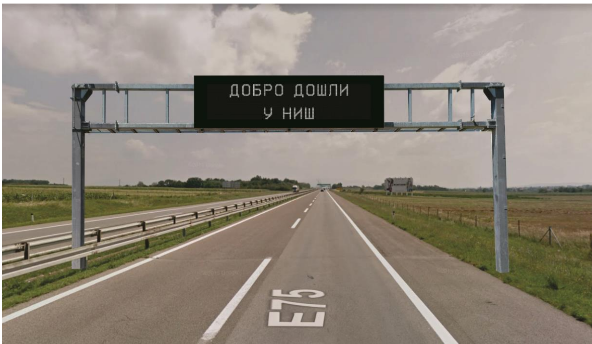
Предлог локације за инсталацију знака Зн7, испред Малчанске петље из правца Београда