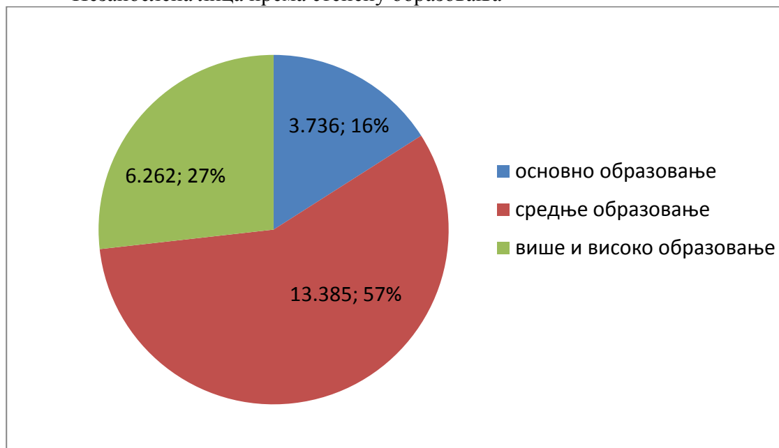
Незапослена лица према степену образовања

У односу на трајање незапослености, дуже од 12 месеци - дугорочна незапосленост, посао тражи 14 837 лице или 64% (стање 30.11.2019. године).